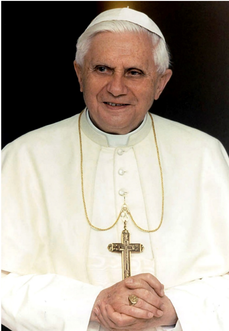
Joseph Ratzinger / Papst Benedikt XVI. 1927 – 2022

Der Herr vergelte ihm, was er in den langen Jahren seines Wirkens als Theologe, Priester, Bischof und Nachfolger des Heiligen Petrus für die Kirche gewirkt hat.